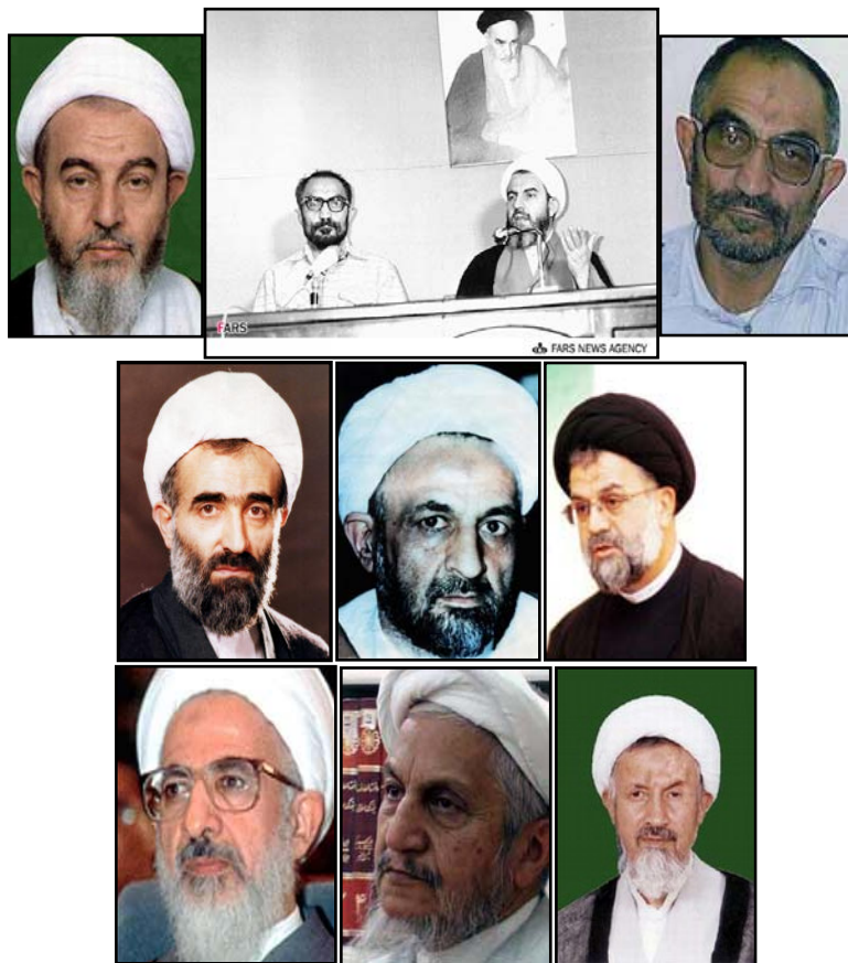
ردیف اول از راست به چپ: اسدالله لاجوردی دادستان انقلاب اسلامی مرکز - محمدمحمدی گیلانی رئیس حکام شرع اوین ردیف وسط: سید حسین موسوی تبریزی دادستان کل انقلاب اسلامی - علی قدوسی دادستان کل انقلاب اسلامی - محمد مهدی ربانی‌املشی دادستان کل کشور ردیف سوم: محمد مؤمن عضو شورای عالی قضایی - یوسف صانعی دادستان کل کشور - عبدالله جوادی آملی عضو شورای عالی قضایی

مثلث لاجوردی، گیلانی و موسوی تبریزی مسئولیت کشتار هزاران زندانی در سال‌های اولیه دهه ۶۰ را به عهده دارند. این افراد از حمایت شورای عالی قضایی و مسئولان دولتی برخوردار بودند. در این بخش علاوه بر مثلث جنایت و شقاوت عکس‌های اعضای شورای عالی قضایی در سال‌های اولیه دهه ۶۰ را قرار داده‌ام. متأسفانه عکس میرمحمدی یکی دیگر از اعضای شورای عالی قضایی را پیدا نکردم و عکس مرتضی مقتدایی دیگر عضو این شورا در بالا آمده است.