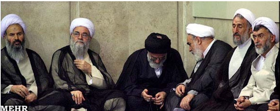
از راست به چپ: حسینعلی نیری-صدیقی- غلامحسین محمدی گلپایگانی- محمود هاشمی شاهرودی- حسین مفید- عبدالنبی نمازی

من‌اسفانه علیرغم تلاش زیادی که به خرج دادم، تاکنون نتوانسته‌ام عکسی از مرتضی اشراقی به دست بیاورم. وی هم‌اکنون رئیس یکی از شعب دیوان عالی کشور است. بسیار ممنون خواهم شد چنانچه یکی از هموطنان دسترسی به عکس او دارد برای من ارسال کند. در عکس‌های زیر حسینعلی نیری را همراه با صاحب منصبان قضایی رژیم می‌بینید.