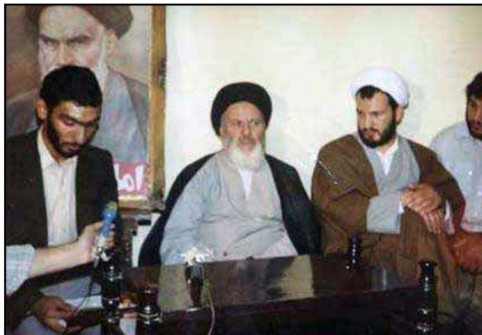
از راست به چپ: علی رازینی- سیدعبدالکریم موسوی اردبیلی- مصطفی پورمحمدی عکس مربوط به سال ۶۳-۱۳۶۲ در مشهد است. علی رازینی، حاکم شرع و مصطفی پورمحمدی دادستان انقلاب مشهد

در عکس زیر مصطفی پورمحمدی و علی رازینی هنگام تصدی پست‌های قضایی در مشهد دیده می‌شوند. این دو در سال ۶۳ به تهران منتقل شدند. پورمحمدی به وزارت اطلاعات پیوست و رازینی جایگزین لاجوردی در دادستانی انقلاب اسلامی مرکز شد.